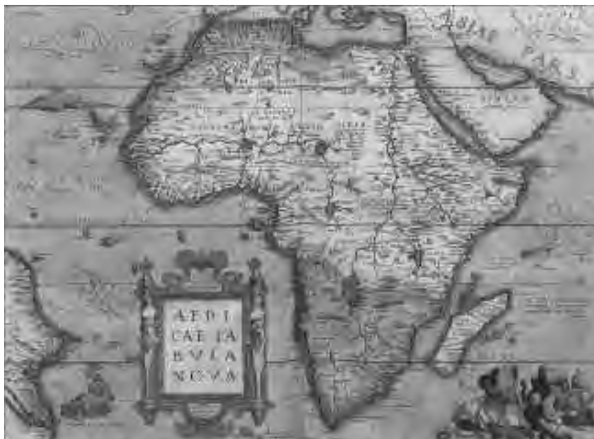
Carte de l'Afrique, 1574 Abraham Ortelius (1527-1598)